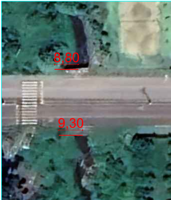
Av. Antonio Paris