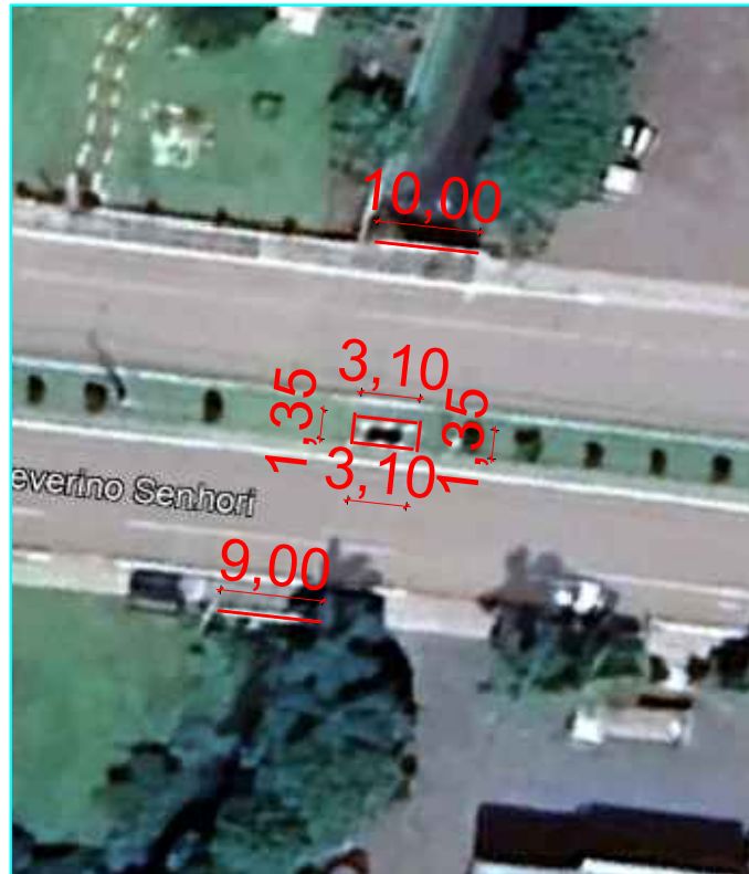
Av. Severino Senhori

Av. Antonio Paris - 18,10 m Rua Natal Zapani - 13,70 m Rua Antonio Nogara - 21,00 m Av. Severino Senhori - 27,90 m