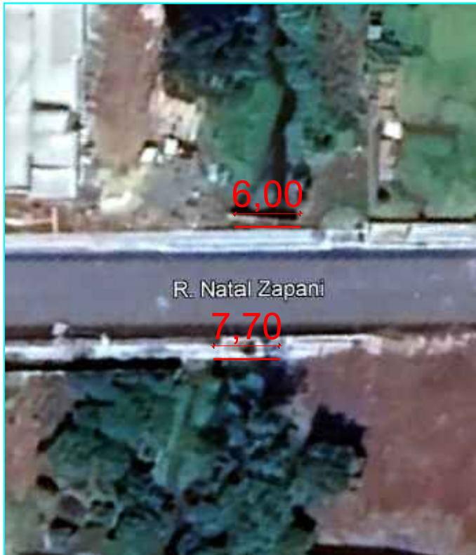
Rua Natal Zapani