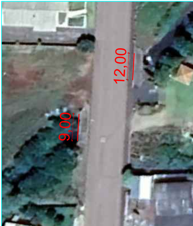
Rua Antonio Nogara